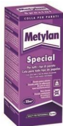
Metylan Special 200g

Práškové lepidlo na báze metylcelulózy ideálne pre lepenie ťažkých, vinylových a ťažko lepiateľných tapiet